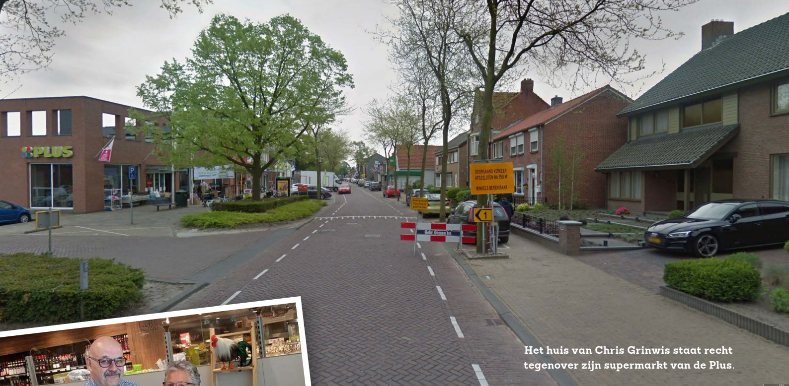
Het huis van Chris Grinwis staat recht tegenover zijn supermarkt van de Plus.